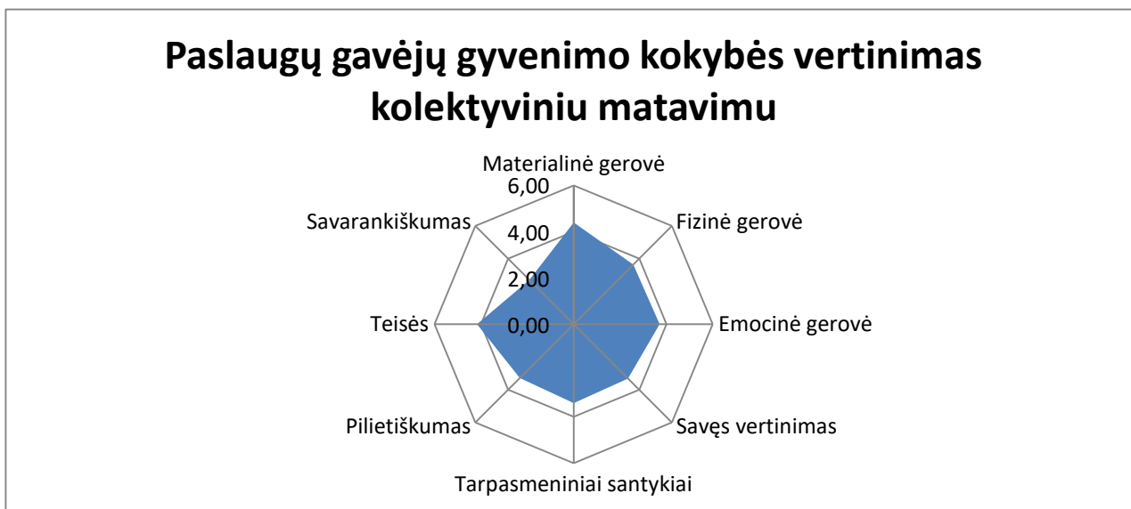
1 pav. Paslaugų gavėjų gyvenimo kokybės vertinimas