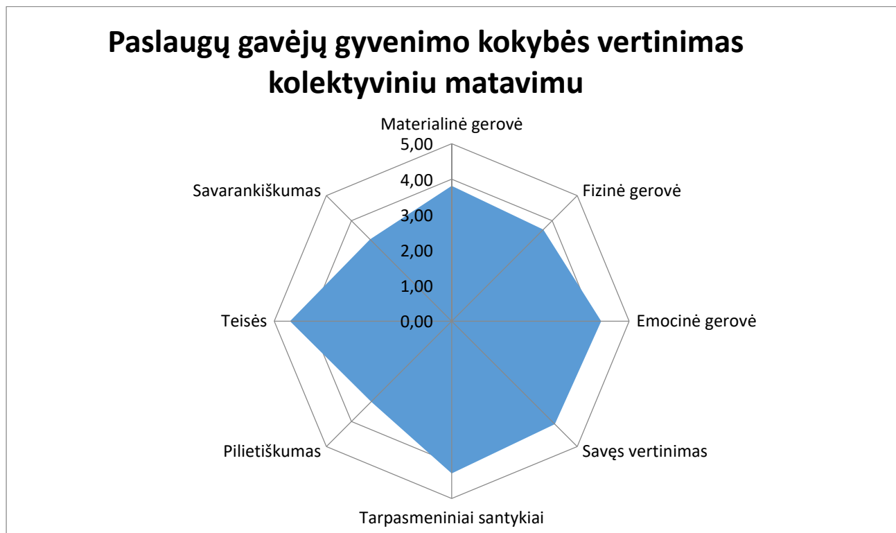
1 pav. Paslaugų gavėjų gyvenimo kokybės vertinimas